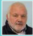
Jean-Marie Dedecker burgemeester